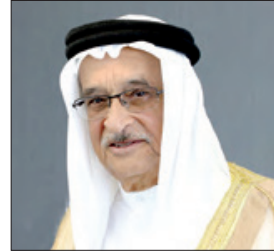
الشيخ محمد بن عبدالله

أكد الفريق طبيب الشيخ محمد بن عبدالله آل خليفة رئيس المجلس الأعلى للصحة، أن مملكة البحرين ماضية في تفعيل توصيات الخطة الخليجية لمكافحة السرطان 2016-2025 في ظل الدعم الذي يحظى به القطاع الصحي بالمملكة من حضرة صاحب الجلالة الملك حمد بن عيسى آل خليفة ملك البلاد المعظم، ومساندة واهتمام مستمر من صاحب السمو الملكي الأمير سلمان بن حمد آل خليفة ولي العهد رئيس مجلس الوزراء. وأشار إلى أن استضافة مملكة البحرين لمؤتمر البحرين الأول للأورام والرعاية التلطيفية في يومي 5 و6 نوفمبر سيكون له أثر كبير في تسليط الضوء على المنجزات التي حققتها المملكة في هذا الجانب، من أجل تقديم الرعاية الطبية اللازمة لكل المرضى بالأورام والرعاية التلطيفية، مضيفاً بأن