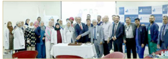
البحرين - مستشفى السلام التخصصي

أطبائنا في مستشفى السلام التخصصي الذي يعمل في أروقته سبعون طبيباً بحرينياً بين أخصائيين واستشاريين من مجموع الطاقم الطبي المكون من 101 طبيب، هؤلاء النخبة من الأطباء البحرينيين يعتبرون من الأفضل في مجالات تخصصاتهم الفريدة من نوعها على مستوى البحرين والمنطقة العربية ويشكلون أعضاء أساسيين في أسرة السلام للرعاية الصحية.