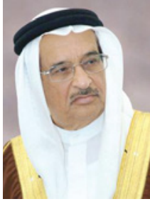
الشيخ محمد بن عبدالله آل خليفة

توصيات الخطة الخليجية لمكافحة السرطان 2016-2025 والحد من أعبائها والمنتقاة من منظمة الصحة العالمية والوكالة الدولية لأبحاث السرطان، حيث سجلت مملكة البحرين تقدماً ملحوظاً في تقديم الرعاية الطبية اللازمة للمرضى.